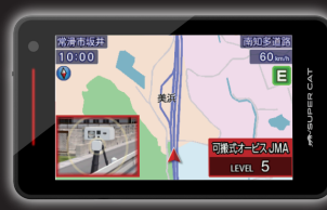
▲ディスプレイ(本体)